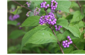
⑩コムラサキシキブ